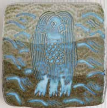
松灰釉陶板「アマビエ」(縦25.4×横25.3×厚み2.7cm)